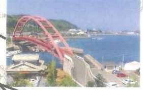
나카우라 주리안이 걸었던 길