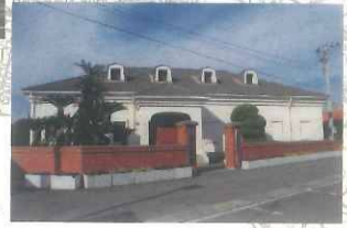
골: 구치노쓰 역사 민속 자료관